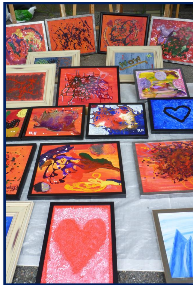
Jentekaféen stiller ut bildene sine på bydelsdagen 2011

Utstillingen vil være åpen på bydelsdagen 2. juni og i påfølgende uke