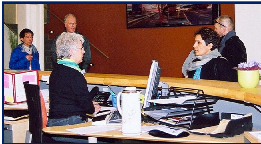
Serviceorget, Engene 1