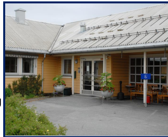
Fjell bo- og servicesenter