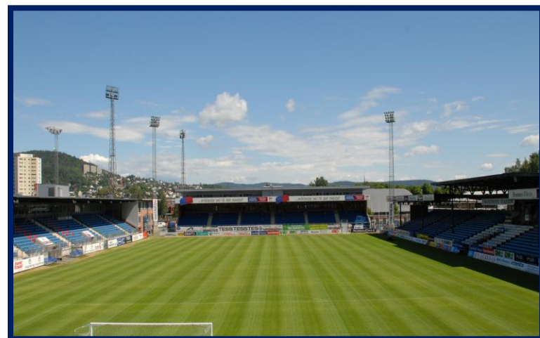
Marienlyst stadion - Gamle gress