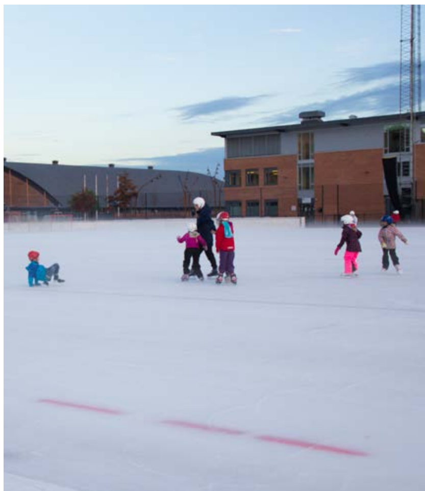
Kunstisbanen på Marienlyst

Det er langt flere enn idrettfolket som liker å være fysisk aktive, for eksempel langs turstiene, i marka eller i byens grøntområder. For å få en liten indikasjon på publikumsaktivitet satte kommunen opp en personteller i Drammen park. Avlesninger viser at hele 255 000 personer passerte tellepunktet i løpet av fjoråret. Tilsvarende persontellere ved Landfalltjernveien og veien opp til Spiralen viser at aktiviteten der også har økt fra 2014 til 2015.