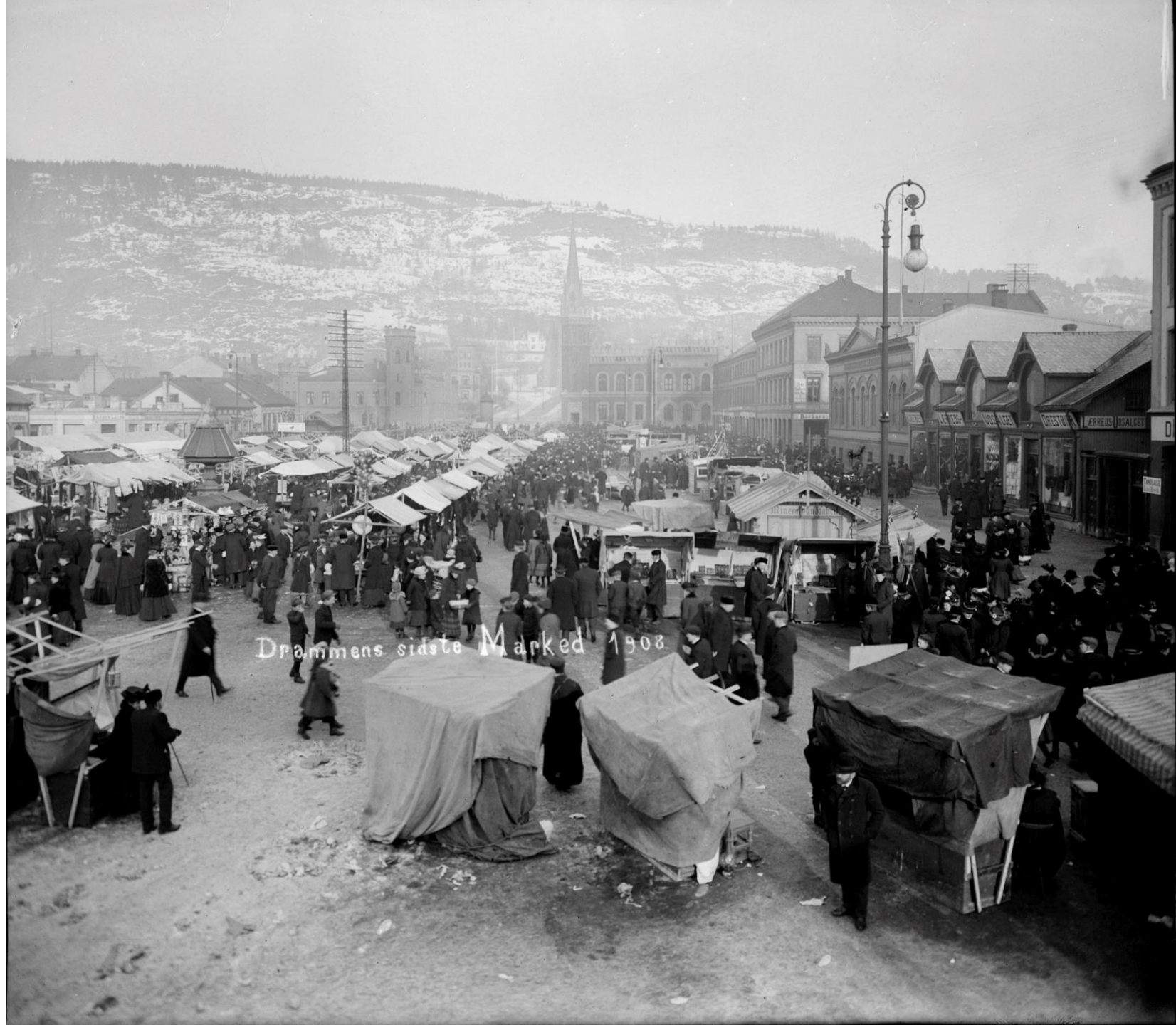
Drammens sidste Marked 1908