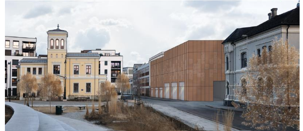
Mulig utforming av parkeringshus mot Grev Wedels plass

Planforslaget legges ut til høring og offentlig ettersyn