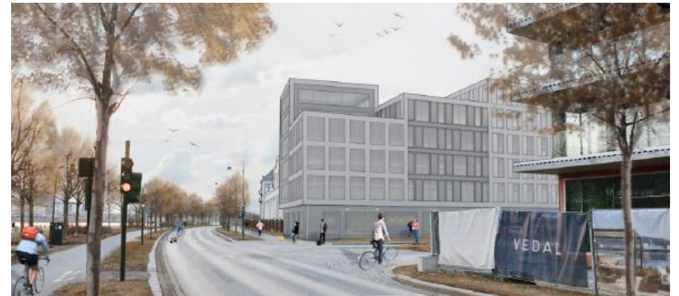
Mulig utforming av nytt næringsbygg i krysset Nedre Strandgate x Losjeplassen