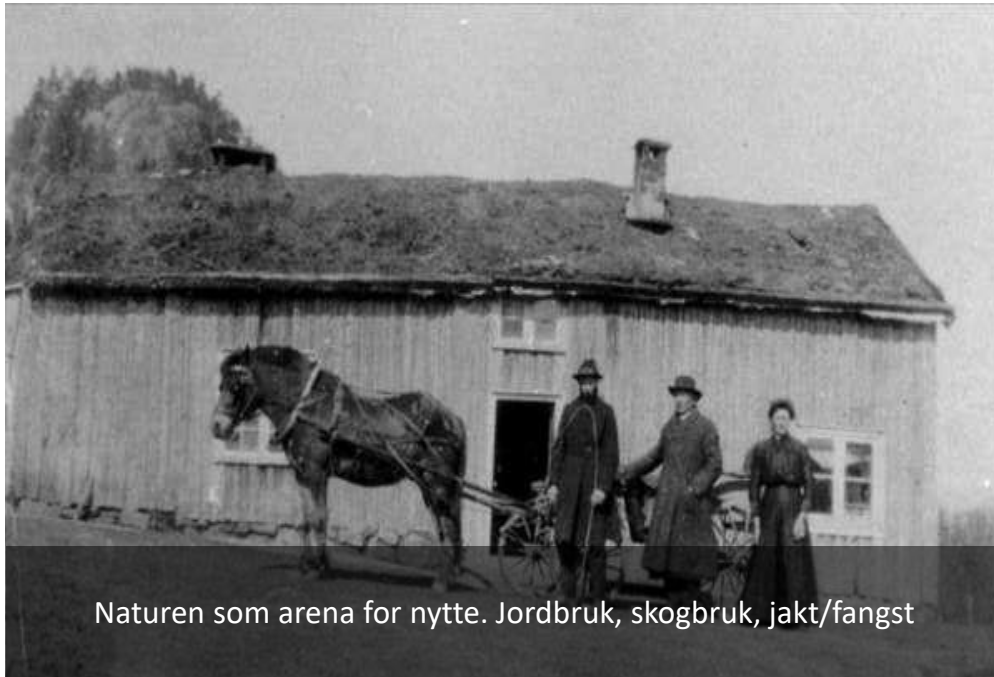
Naturen som arena for nytte. Jordbruk, skogbruk, jakt/fangst