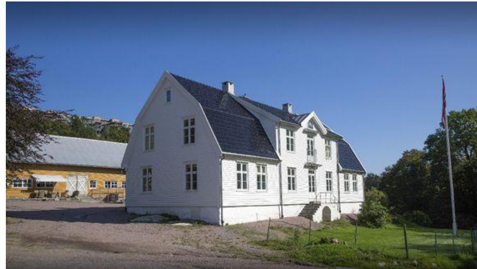
Jegersberg gård – rehabiliterings og kompetansesenter