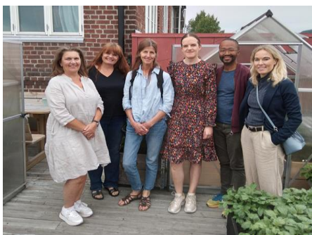
Besøk av Ungdomstorget