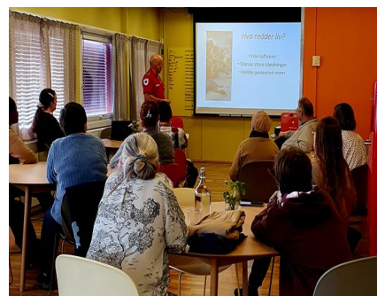
Kurs i bruk av hjertestarter