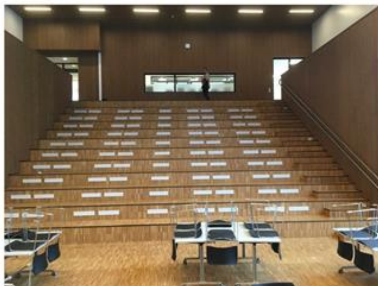
Bjørn Boge Rådgivning AS

Trappeamfi med til luft ventilasjon. Lav lufthastighet gir bakgrunnsstøy under 30 dB. Salen brukes som kantine. Bord på hjul gir svært raske omrigg. Lærerværelser og adm. i 2. etasje bak sal er ikke plaget av støy fra salen. Inngang til sal fra begge sider av amfi på grunnplan, og fra 2. etasje. Salen kan brukes uavhengig av annen aktivitet på skolen, som egen sone.