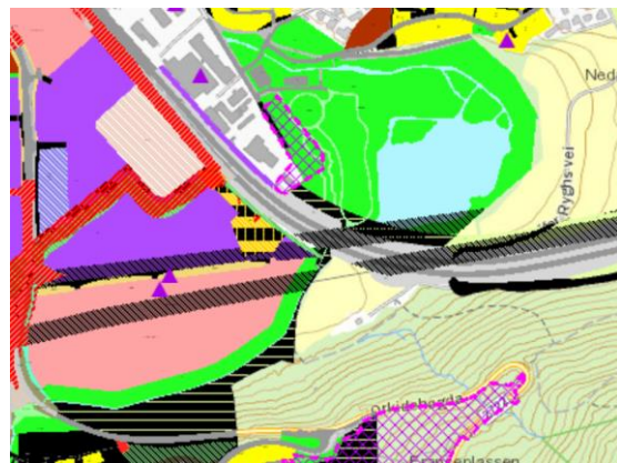
Gjeldende og pågående reguleringsplaner

Det pågår for øyeblikket en detaljregulering rett vest for Miltjern (se lilla rutete markering over). Dette er en detaljregulering i tråd med kommuneplanens arealdel, og området reguleres til næringsformål.