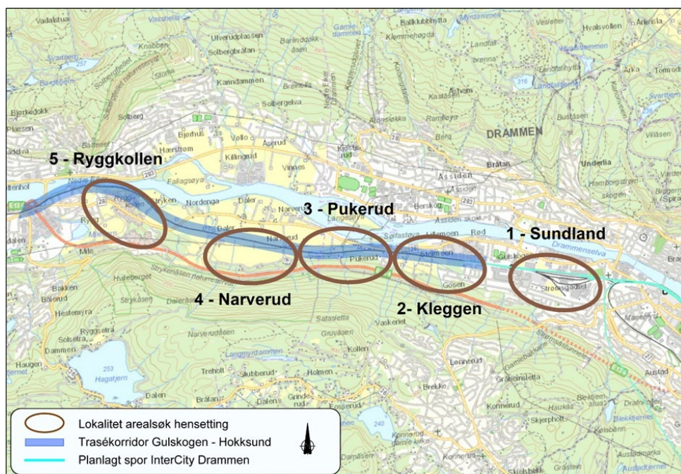
Lokalisering av hovedalternativene for hensetting i Drammensområdet

Parallelt med sluttbehandlingen av planprogrammet har Bane NOR utarbeidet en kommunedelplan med konsekvensutredning. I kommunedelplanen har Bane NOR utredet totalt 9 lokaliseringalternativer; de 5 hovedalternativene med byggetrinn 1 og 2 samlet på samme sted, som vist på bildet over, og 4 delte anlegg med Sundland som byggetrinn 1 (13 plasser) i kombinasjon med byggetrinn 2 (12 plasser) på et av de fire andre stedene, for eksempel Sundland + Kleggen.