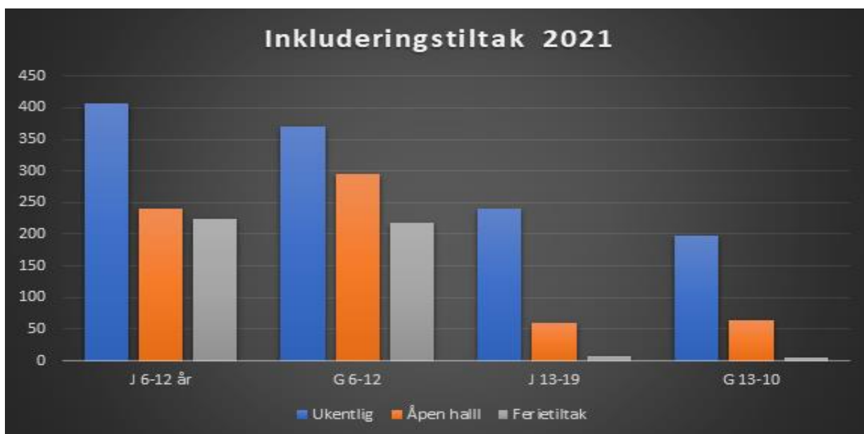
Figur 1 Med bakgrunn i pandemien har idrettslagene til tider måttet redusere antall barn og unge for å ivareta smittevern regler. Det har til tider vært krevende for frivilligheten å ivareta alle hensyn samt ha nok frivillige for å gjennomføre aktivitet.